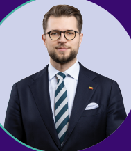
Lukas Savickas Ekonomikos ir inovacijų ministras